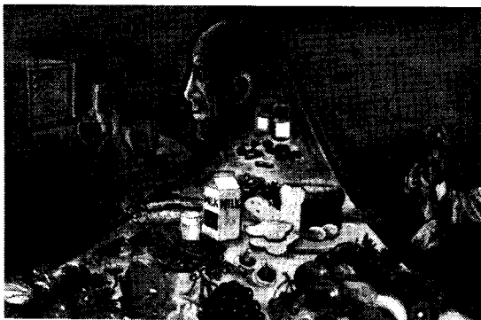
Die Folgen des Erfolgs. Seite 6