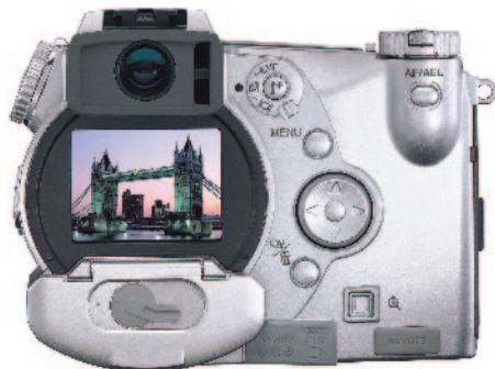
LCD-Monitor zur Aufnahmekontrolle.

So können Sie auch schnell einmal durch die gespeicherten Bilder blättern. Das ist nicht nur ein nettes Gimmick, sondern kann unterwegs praktisch sein, wenn man feststellen muss, dass der Speicherplatz zur Neige geht und keine weiteren Fotos mehr aufgenommen werden können. In so einem Notfall ist es dann immer noch möglich, einige der bereits aufgenommenen Fotos wieder zu löschen.