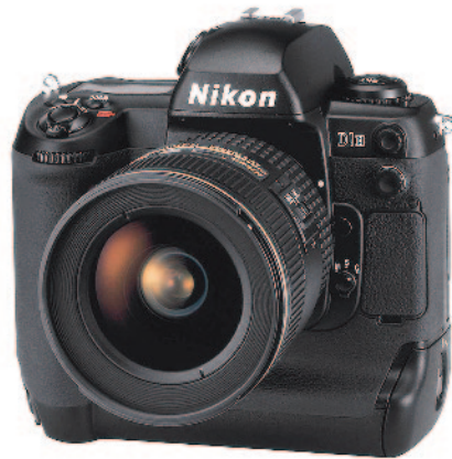
Spiegelreflexkamera mit Bajonettanschluss für Wechselobjektive.

rem Masse bei einem Wechsel des Objektivs: Die Änderungen in Bildwirkung und Perspektive sind unmittelbar zu beurteilen. Und wenn die Kamera einen Abblendhebel hat, dann kann sogar die Schärfentiefe direkt beurteilt werden.