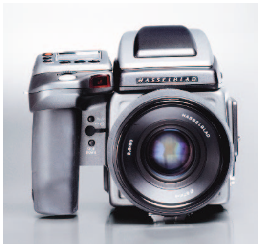
Mittelformatkamera für digitale und analoge Rückteile.

Mittlerweile bieten alle bedeutenden Kamerahersteller digitale (Kleinbild-) Kameras auf Basis der Spiegelreflextechnik an. Sie werden zunehmend handlicher, leistungsfähiger – und preiswerter. Ihr großer Vorteil: Sie ermöglichen die Verwendung von Wechselobjektiven.