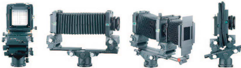
Kamera nach dem Prinzip der optischen Bank mit Mattscheibe.

Bei Studio- respektive Großformatkameras schließlich trifft man auf eine nur scheinbar antiquierte Art der Sucherbilddarstellung: die Mattscheibe, die das Bild Kopf stehend und seitenverkehrt zeigt.