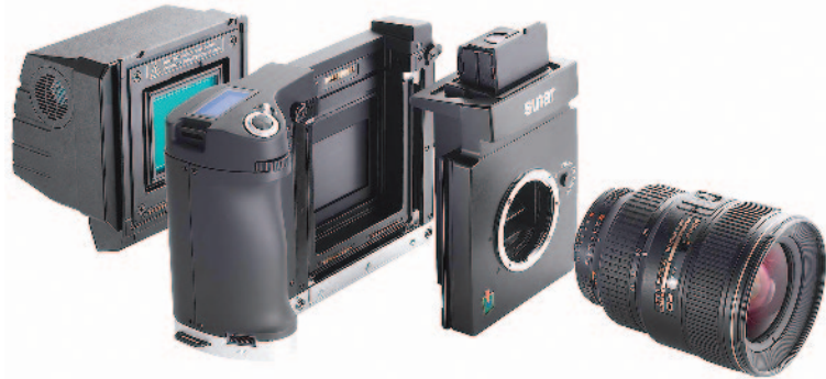
Baukastensystem mit digitalem Rückteil.

Die Mattscheibenbetrachtung ist dabei kaum mehr notwendig. Das digitale Rückteil wird statt der Mattscheibe in der Filmebene montiert und zeigt das Foto direkt auf dem Computermonitor an. Aus dem optischen wird ein elektronischer Sucher.