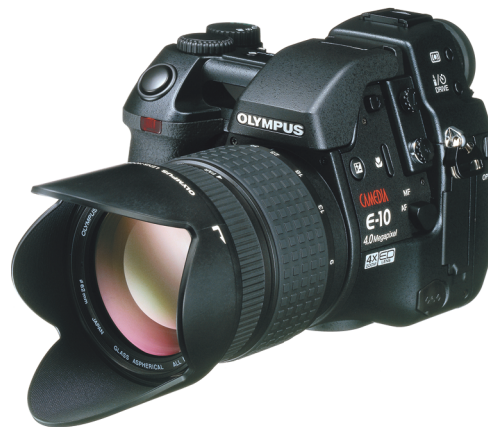
Spiegelreflexsucher, aber keine Wechselobjektive: Eine typische „Brücken- kamera“.

Neben den Spiegelreflexkameras mit Wechselobjektiven existiert auch noch die Gattung der kompakten Spiegelreflexkamera. In der analogen Fotografie werden sie „Brückenkamera“ (bridge camera) genannt. Damit sind jene kompakten Kameramodelle gemeint, die in der technischen Ausführung zwischen Kompakt- und Spiegelreflexkamera angesiedelt sind. Von der Kompaktkamera haben sie die unkomplizierte Bedienung und das fest eingebaute (Zoom-) Objektiv, von der Spiegelreflex das Sucherprinzip, das die genaue Kontrolle des Bildausschnittes, der Filterwirkung, der Schärfentiefe usw. erlaubt.