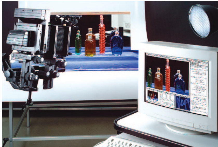
Studiosysteme sind orts- gebunden.

Die Mattscheibenbetrachtung ist dabei kaum mehr notwendig. Das digitale Rückteil wird statt der Mattscheibe in der Filmebene montiert und zeigt das Foto direkt auf dem Computermonitor an. Aus dem optischen wird ein elektronischer Sucher.