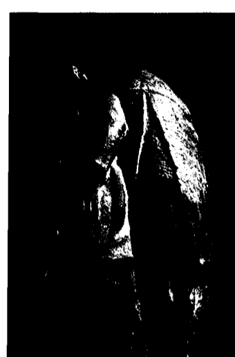
378 X. Spätwerk: Die letzten Gemälde und Skulpturen 1540–1564 Frank Zöllner