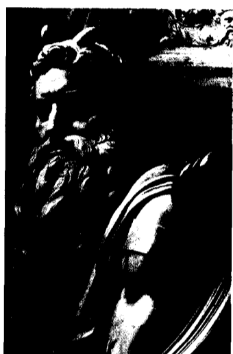
228 VII. Der Bildhauer 1513–1534 Frank Zöllner