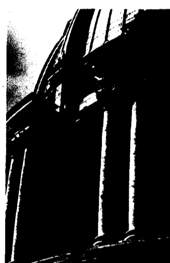
354 IX. Der Architekt in Rom 1534–1564 Christof Thoenes