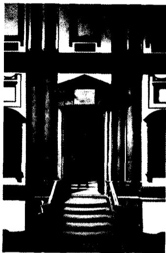
214 VI. Der Architekt in Florenz 1513–1534 Christof Thoenes