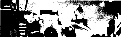
Künstliche Klimate 104