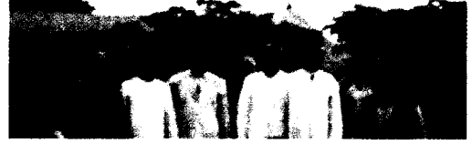
Ostafrika-Expedition des Meteorologischen Observatoriums Lindenberg, 1908 158

Hartmut Graßl Klimawandel und Klimapolitik: Daten, Szenarien, Fragen 154