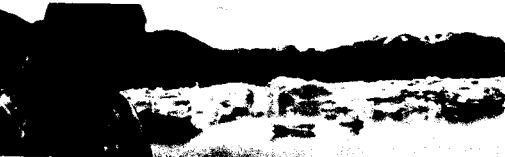
Zeugen des Klimawandels 149

Spencer R. Weart Kurze Geschichte der Entdeckung der Erderwärmung 144