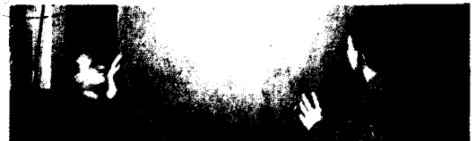
Meteorologisches Observatorium Lindenberg 81