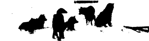
Historische Polarforschung 138

Spencer R. Weart Kurze Geschichte der Entdeckung der Erderwärmung 144