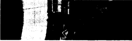
Utopische Klimate 116

Florian Rötzer Globale Technik für den globalen Klimawandel. Die Großprojekte des Geoengineering zur Rettung des irdischen Klimas 120