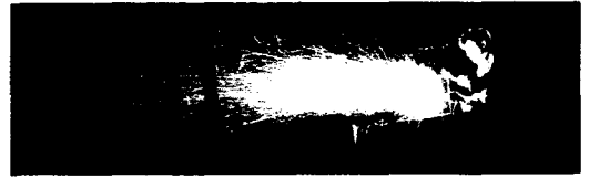
Das »Project Cirrus« 62

Christian Pfister Von der Hexenjagd zur Risikoprävention. Reaktionen auf Klimaveränderungen seit 1500 56