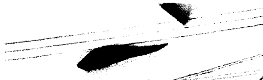
Schnee und Eis 50

Ulrike Brunotte Die Bühne der Götter. Figurationen religiöser Meteorologie 43