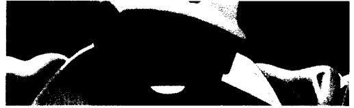
Die Erfindung des Wintersports 170

Achim Steiner Von Bali nach Kopenhagen und darüber hinaus 164