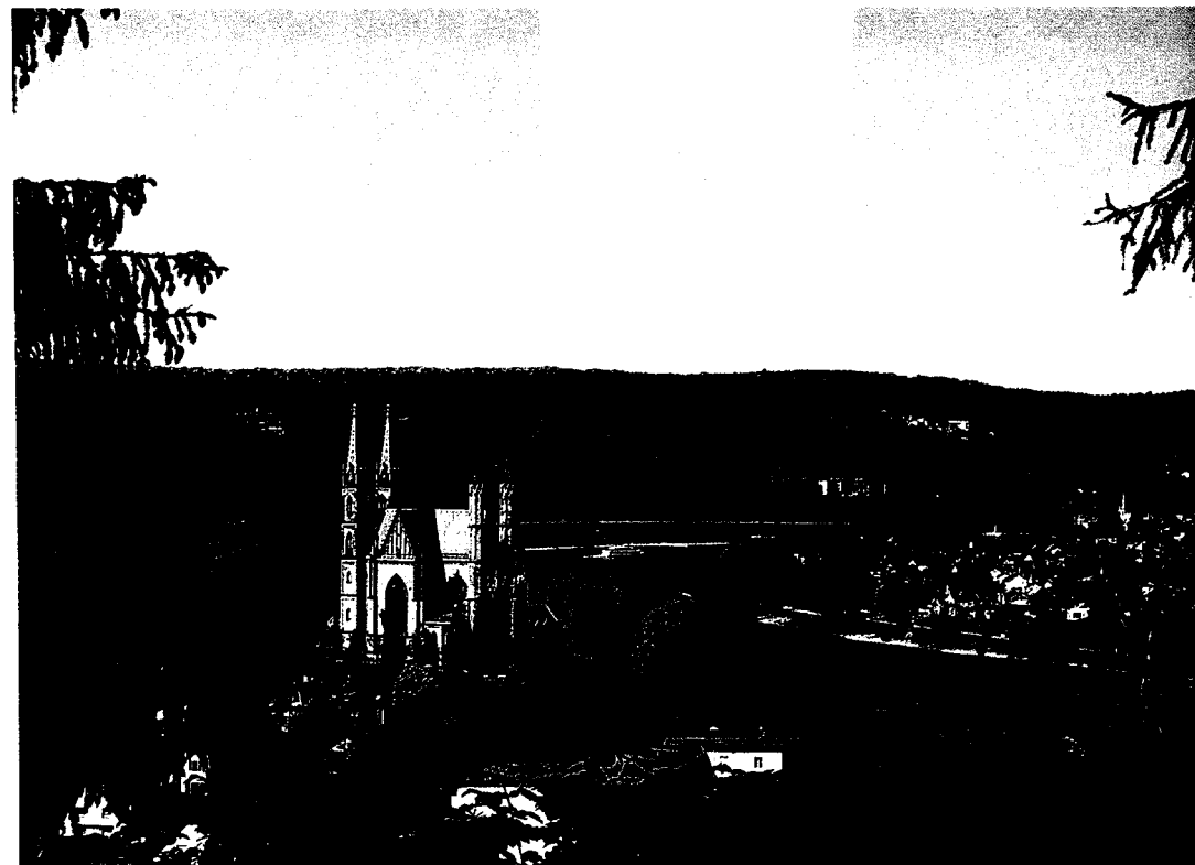
Die Apollinariskirche von Remagen steht auf einer Anhöhe über dem Rhein.