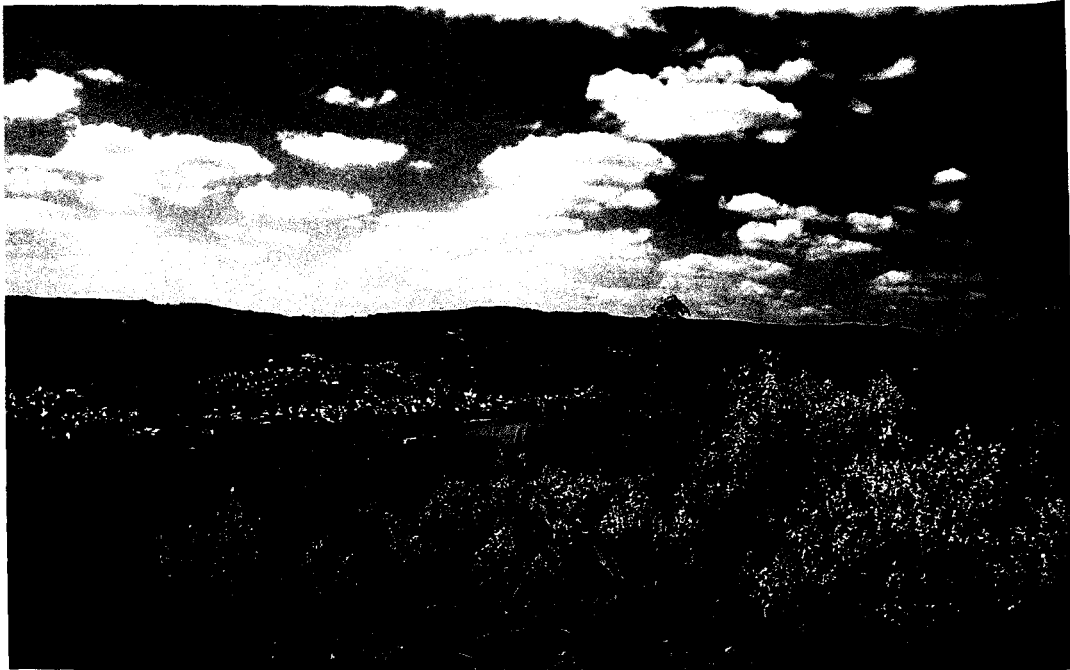
Blick von der Kerkertser Platte