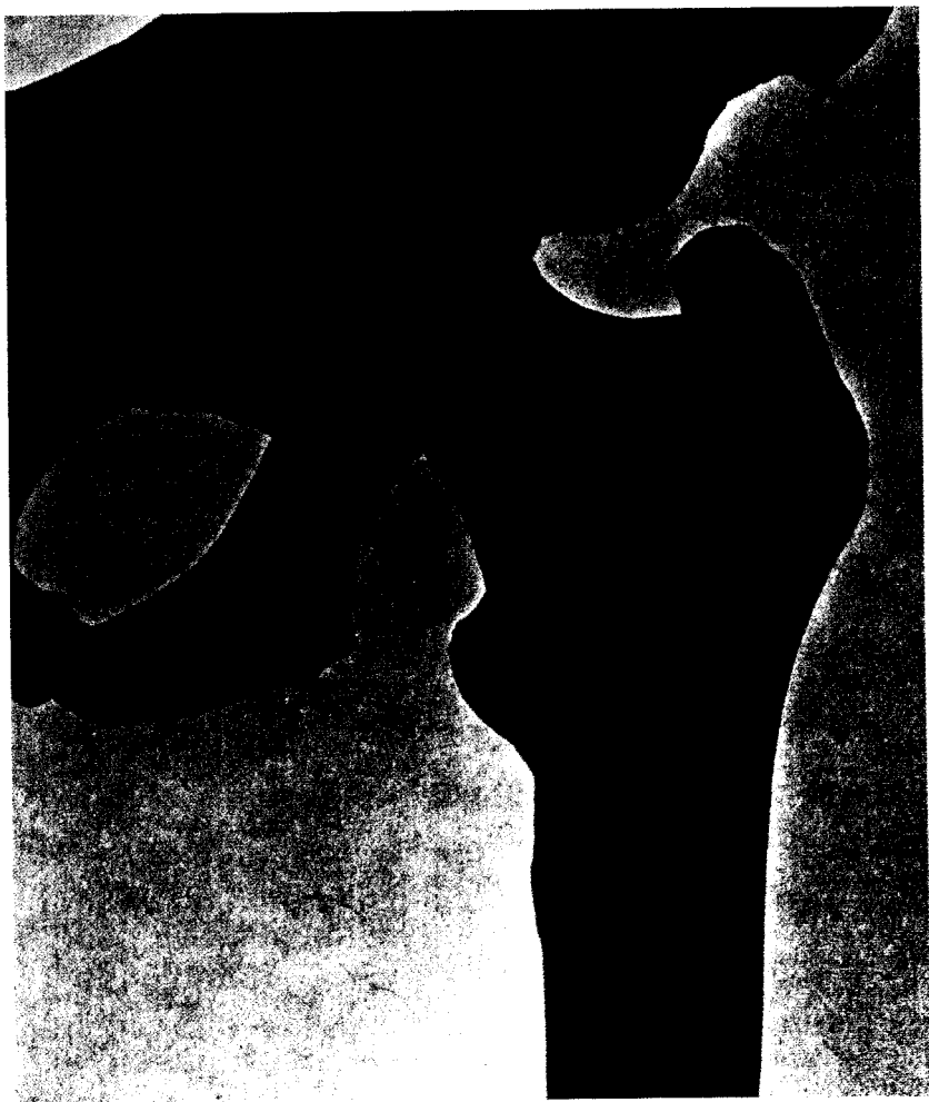
Abb.: Oberschenkelhalsknochen. Die Schwachstelle. Einer weiß daß es kommen wird, kann aber gegen den Fall nichts tun. »Gewalt des Zusammenhangs.«

Dialektik ungrammatisch 711 – Schwierigkeiten, dialektische Wahrnehmung sinnlich zu verwurzeln 712 – Die Eigenart von alltäglichen Bewegungen 716 – Drehung von Herr/Knecht-Verhältnissen 716 – Stadt/Bomben 719 – Unterschiede der Uhren 721 – »Eine entsetzliche Tat, verübt in der Stille« 723