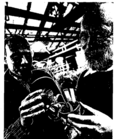
Warum die Pflanzenforscher von Ceplas exzellent sind. Seite 18