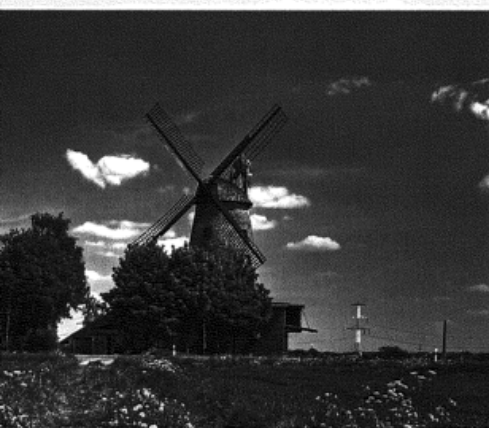
❶ Seite 06 - 21