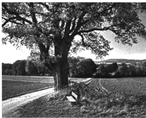
5 Seite 68 - 99