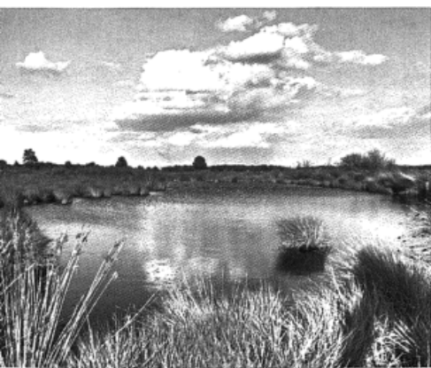
4 Seite 58 - 67