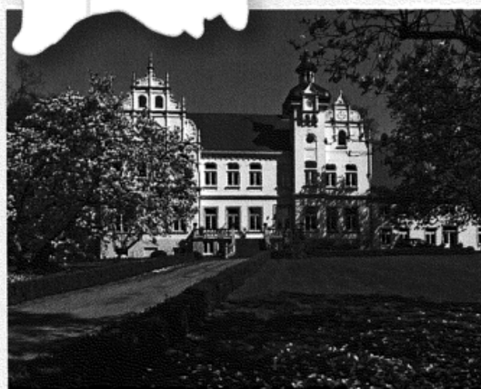
❷ Seite 22 - 41