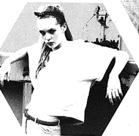
Das ist öko! S. 10