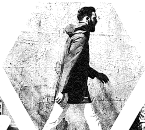
Upcycling & Recycling S. 18