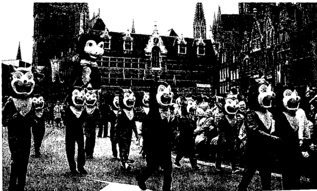
›Katzenumzug‹ in Ipern (S. 287)