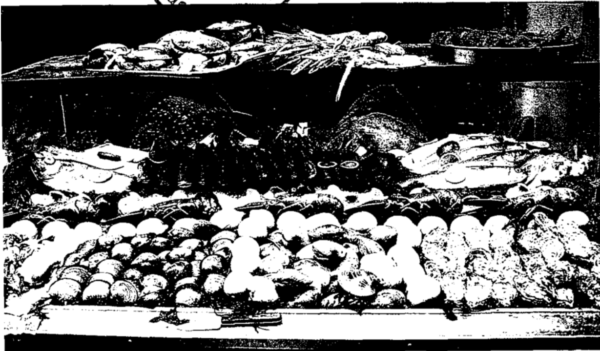
Frische Fische fehlen nie in der belgischen Küche (S. 360)