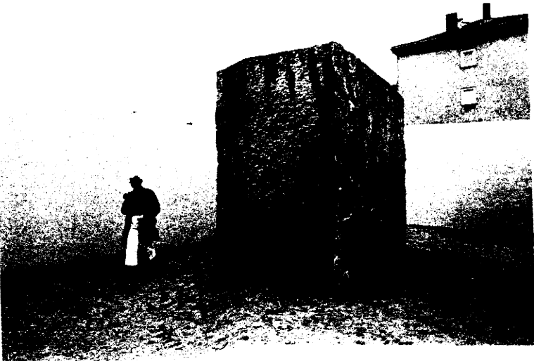
Ulrich Rückriem: „Museum des Steins“, 1987, Kassel