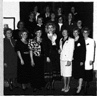
S. 130: Die Lady-Lions sind im Kommen. Hier: LC Rheurdt Niederrhein