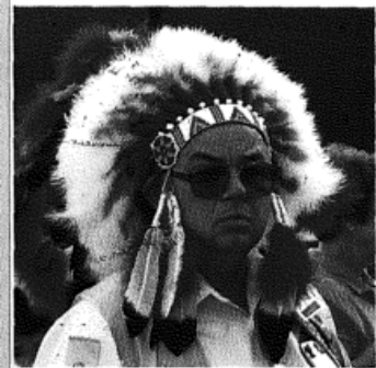
S. 182: World Conventions – Souvenirs, Souvenirs Von Fred Huck