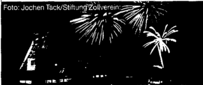
Das UNESCO-Welterbe Zollverein ..... S. 43