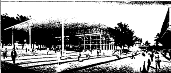
Messe Essen ..... S. 47