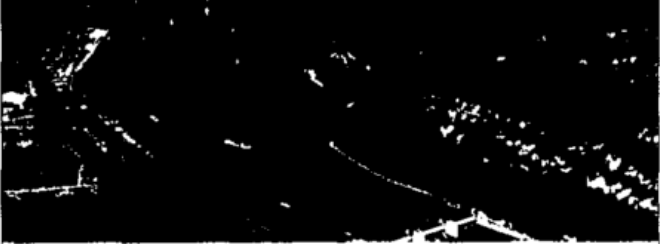
Baldeney See ..... S. 60