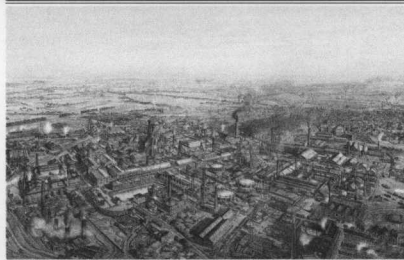
Darum geht es ...