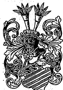
KNIPPENBURG auch KNIPPENBERG