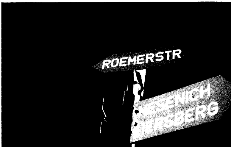
Wegweiser oberhalb von Liersberg