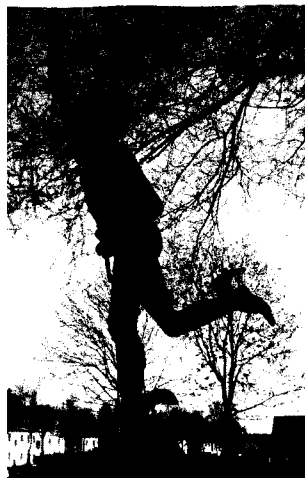
eilender Merkur mit Flügelschuhen (Birkenfeld)