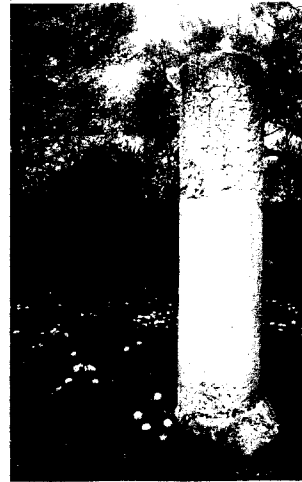
Meilenstein bei Nettersheim