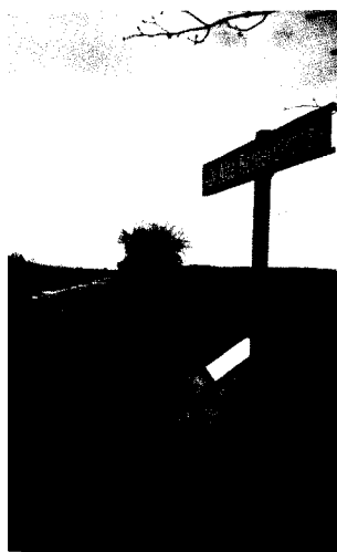
Alte Römerstraße am Helenenkreuz im Saargau